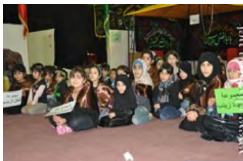
حسينيه ها ٥ : مجلس بقية الله در دمام در فعاليت مخيم الطفل الحسيني