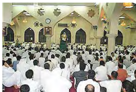
حسينيه ها ٣ : حسينية السنان در قطيف