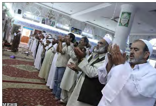
مساجد ۵ : باغ العمري در مدینه .