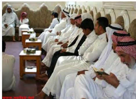
حسينيه ها ٤ : مجلس النمر در دمام .