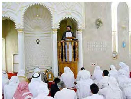
مساجد ۱ : جامع رسول اعظم در احساء