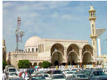
مساجد ۳ : جامع امام حسین در شهر دمام