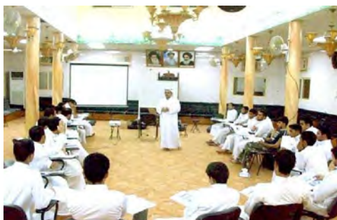
حسینیه ها ۲ : الحسينية الفاطمية در احساء