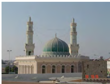
مساجد ۴ : مسجد فتح در قطیف