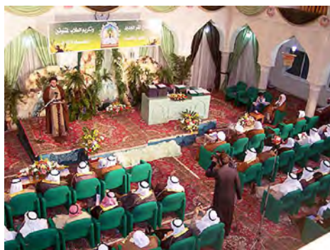
حوزها ١ : جشنی در حوزة الاحساء العلمية