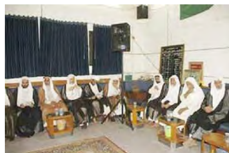
حسینیه ها ۱ : الحسينية الجعفرية در احساء