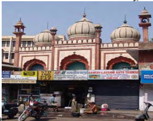
فخر المساجد کشمیر