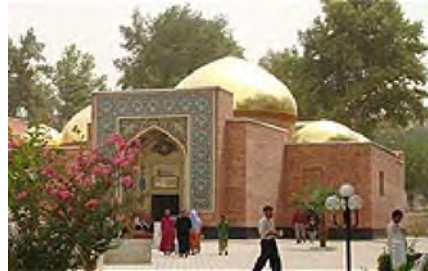
مقبره سیدعلی همدانی

اسلام به وسیله یکی از علمای بزرگ به نام «سید شرف الدین» معروف به «بلبل شاه» در کشمیر رسمیت یافت تشیع نیز با همت علمای بزرگی چون «سید علی همدانی» و «سید محمد مونی» و «سیدحسین رضوی قمی» و «ملا عالم انصاری» و خصوصاً زحمات فراوان «میر شمس الدین عراقی (اراکی)» به گسترش فراوانی رسید. ۳